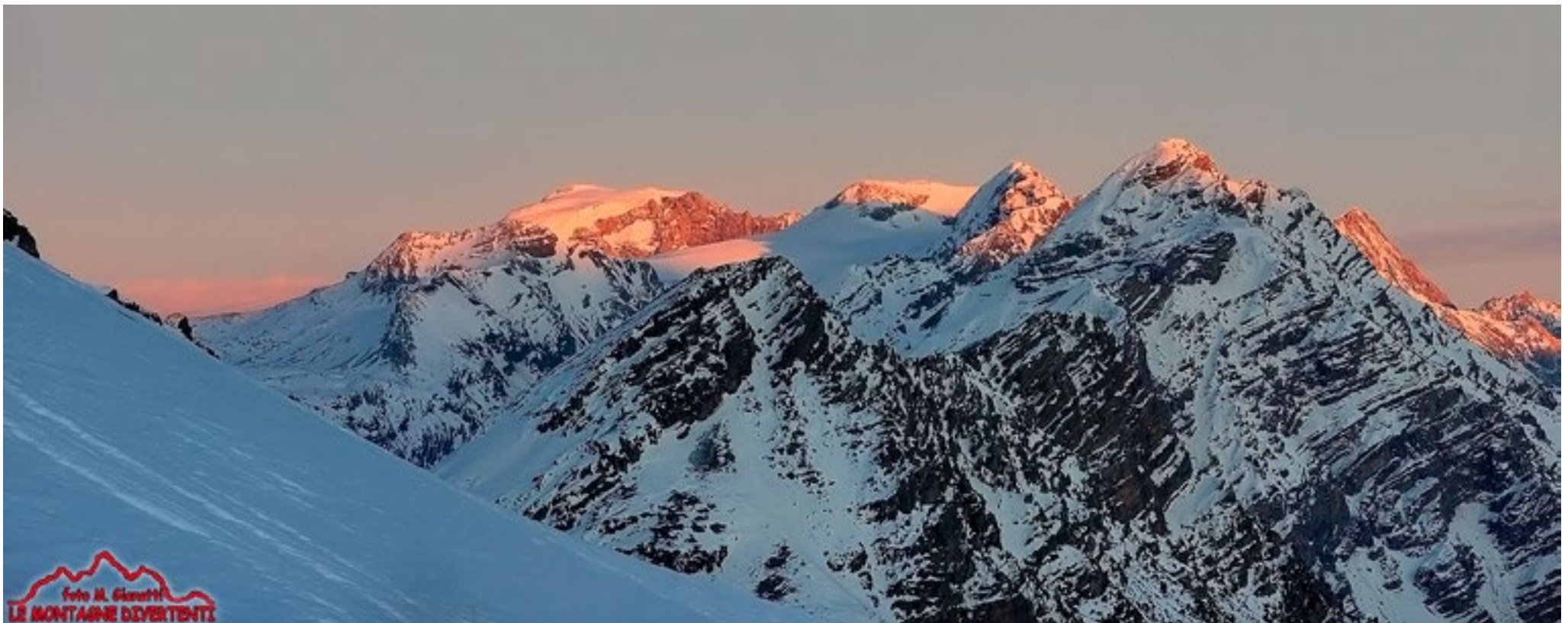
Sopra: tramonto sui giganti dell'alta valle dal monte Trela (16 gennaio 2020). Sotto: ultimi raggi di sole sul monte Brione (m 2547, 31 gennaio 2020).