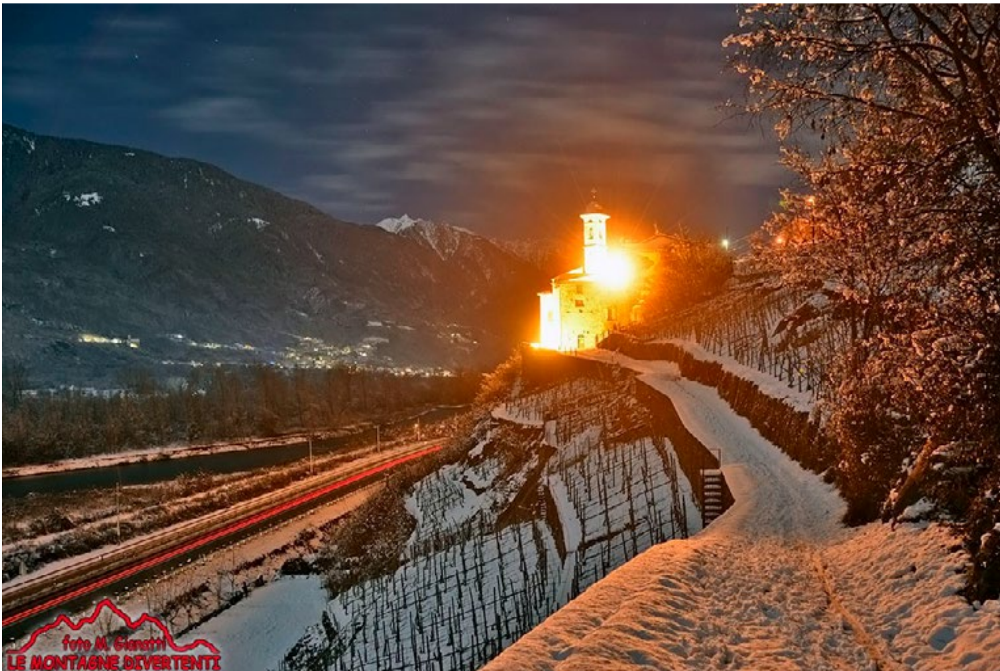
Il santuario della Sassella alle porte di Sondrio protagonista del connubio perfetto tra neve fresca e luna piena (13 dicembre 2019).