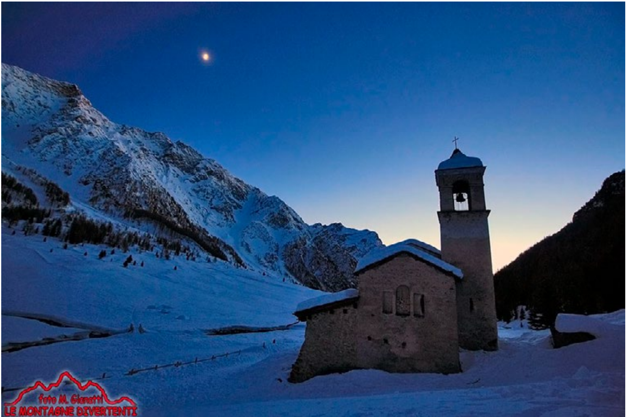
La chiesetta di San Bernardo in val di Rezzalo all'ora blu (2 gennaio 2020).