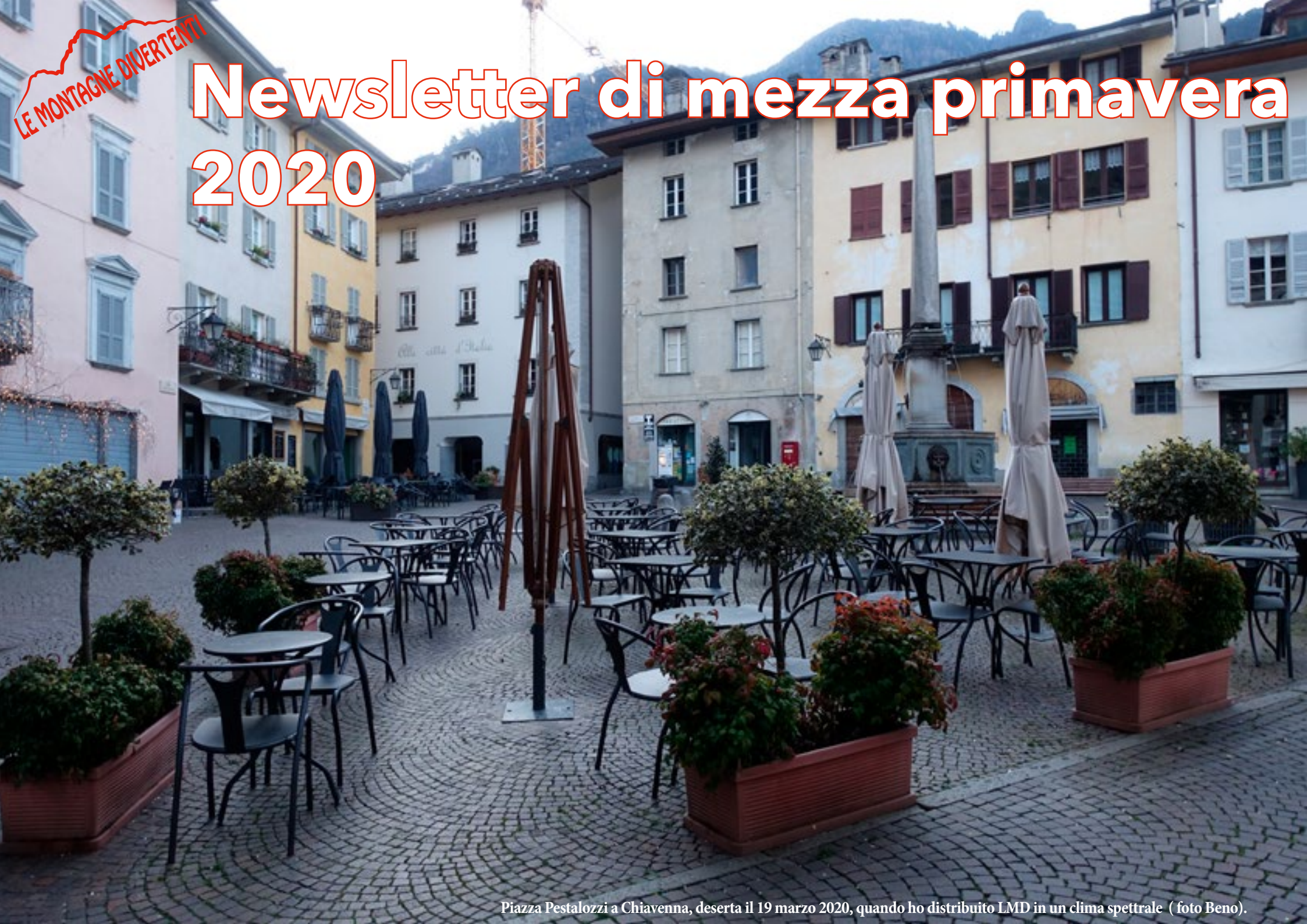
Piazza Pestalozzi a Chiavenna, deserta il 19 marzo 2020, quando ho distribuito LMD in un clima spettrale.